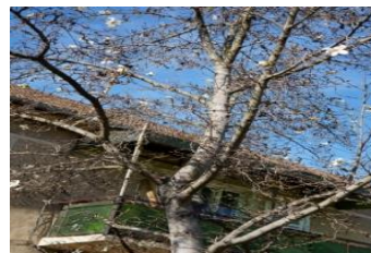
Eram un copac înflorit