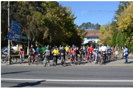
'Keep Fit, Stay Well': community bike ride in Tarnaveni