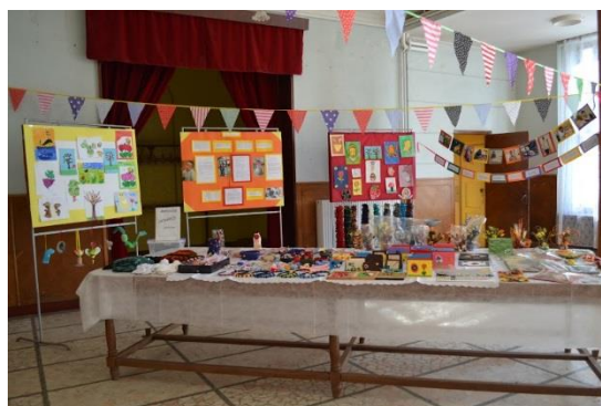
'This is Me': Exhibition for World Mental Health Day