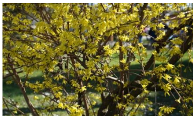
Eram ploaie de aur