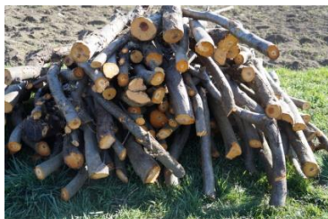
Dar m-au tăiat